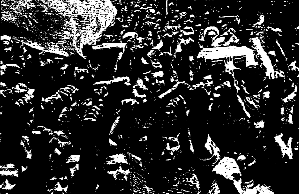
عناصر من حزب الله يشيخ جثمان اثنين من قتلتهما اسراييل